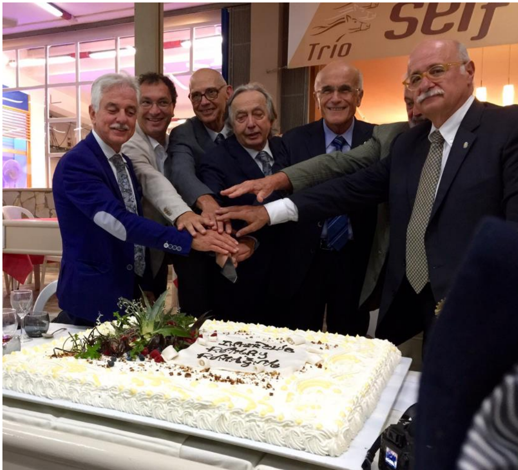
I presidenti Rotary Romagna e al Centro il Governatore Paolo Pasini

"Fa particolarmente piacere a me ed alla rappresentanza forlivese ( 16 persone provenienti dal Club e dal Rotaract ) essere qui questa sera, primo perchè si tratta di una piacevolissima iniziativa Interclub, resa ancora più importante dalla presenza del Governatore Paolo Pasini e dalla presenza di numerose autorità rotariane di livello distrettuale; secondo perchè questa sera ci troviamo tutti insieme in una location, quella dell'Ippodromo di Cesena, che è veramente inusuale e magnifica e, quindi, desidero ringraziare con particolare gratitudine sia il Presidente