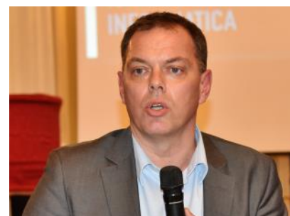
Prof. Luciano Margara

ma operativo (sia in termini di organizzazione interna, sia in termini di rapporti esterni con il territorio circostante) e di definire alcune iniziative da condurre a livello distrettuale ed a livello di interclub.